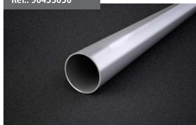
Tubo de enrollle Roller Tube Tube d'enroulement Tuchwalze