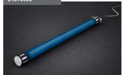
Motor Front Shadow Front Shadow motor