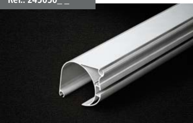
Perfil carga Front Shadow Front Shadow load profile Barre de charge Front Shadow Fallstange Front Shadow