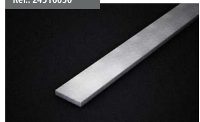
Perfil contrapeso Front Shadow Front Shadow counterweight profile Barre de lestage Front Shadow Gegengeprofil Front Shadow