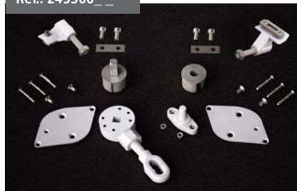
Kit accesorios Front Shadow Front Shadow accessory kit Kit accessoires Front Shadow Zubehör-Set Front Shadow